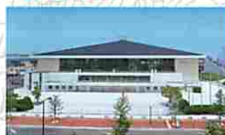
福岡国際センター 〒812-0021 福岡市博多区築港本町2-2 TEL 092-272-1111